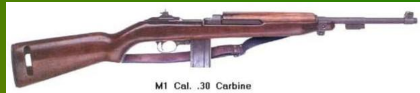
M1 Cal. .30 Carbine